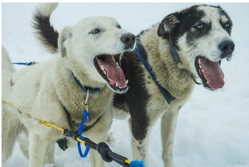
Die Hunde bellen - Psy szczekają

A o to przykłady innych czasowników dźwiękonaśladowczych: